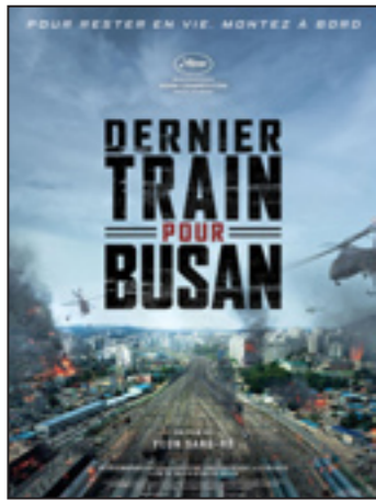
Dernier train pour Busan Busanhaeng

Corée du Sud - 1h58 - 2015 - Présenté en V.O.s.t.