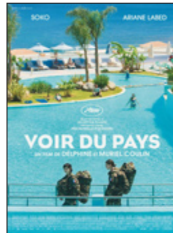
Voir du pays

Cinophiles lycéens, bénéficiez de séances à un euro seulement grâce à votre carte M'Ra!