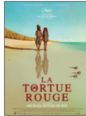
La Tortue Rouge The Red Turtle