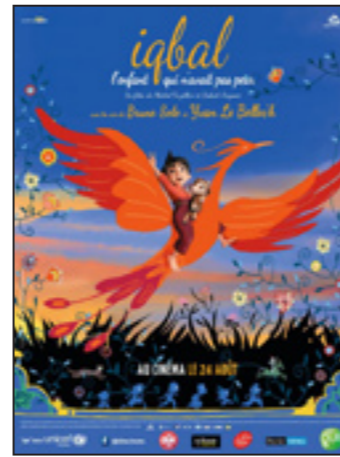
Iqbal, l'enfant qui n'avait pas peur

« Alain Guiraudie (...) est désor- mais l'un des auteurs français les plus créatifs et les plus ori- ginaux. Rester vertical, son cin- quième long métrage, n'a peut- être pas l'efficacité irrésistible du précédent, mais, conformé- ment à son titre, c'est du ciné- ma débout : pas question pour Guiraudie de se reposer sur une recette (le thriller érotique) qui lui a réussi. Aucune concession aux normes et aux standards, qu'il s'agisse de l'histoire, de la mise en scène, des acteurs ou de la pensée. » Télérama