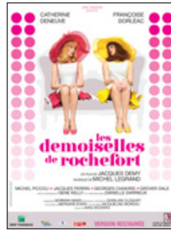
Les demoiselles de Rochefort

«Avec l'appui décisif d'un acteur étonnant, Josef Hader, le film décrit un sentiment subtil : le détachement. Une note mélancolique que reprend chaque séquence, dans une cohé- rence stylistique parfois monotone. Mais cette insistance permet de montrer comment ce détachement se charge, peu à peu, d'une force délétère, tragique.» Télérama