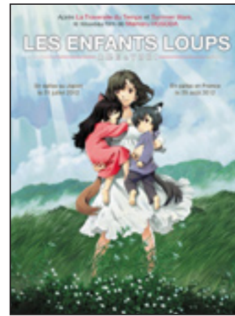
Les enfants loups, Ame & Yuki

Japon - 1h57 - 2012 - À partir de 9 ans.